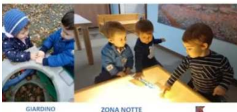
GRUPPO NIDO ARCOBALENO E GIRANDOLA Parole che ci sono vicine