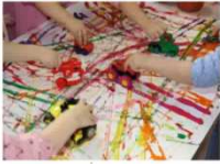
SCUOLA SAN BENEDETTO ABATE BENESSERE INCLUSIONE FRAGILITÀ

In questa foto tutti i bambini usano uno strumento individuale e una mano, uno strumento che non fa sentire la forza con la quale passano il colore, non hanno contatto con il colore stesso. Qui è presente un atto motorio, ma poco di percettivo e di osservazione dell'altro. Una volta finito c'è un prodotto che appeso al muro interessa l'adulto, ma non al bambino a cui interessa il