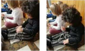
SCUOLA MADONNA NEVE Contesto animali