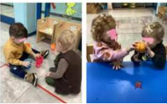
SCUOLA / NIDO ? (Cecilia) BENESSERE INCLUSIONE FRAGILITÀ

Il linguaggio universale dei bambini è la comunicazione non verbale, mediante il corpo(indicare, imitare, usare oggetti, espressioni, gesti,ecc). Anche per gli educatori occorre maggiore attenzione ad usare il corpo per comunicare, meno parole. Il primo passo è mettersi ad altezza bambino ed entrare nel gioco, provando a sperimentare.